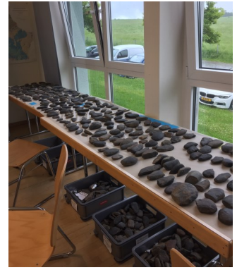
Au cours du workshop, plus de 1000 haches représentant différents états d'élaboration ont été examinées pour reconstituer et comprendre la chaîne opératoire de la fabrication de ces outils.

Le workshop sur les haches noires qui s'est déroulé du 20 au 25 mai a permis de mieux comprendre et de caractériser les différentes étapes de la fabrication des haches - du galet brut à la hache finie. De même il a permis de reconnaître le recyclage de certaines pièces - à différents stades de la production et de l'utilisation - pour d'autres fonctions que l'abattage d'arbres et le travail du bois. Des séries d'objets de référence de chaque « type », constituées à partir du riche matériel de la région de Diekirch aimablement mis à disposition par J.-P. Scheifer, serviront à la rédaction d'un article collectif présentant les résultats du workshop dans le prochain Bulletin de la S.P.L. Au cours de cet atelier, Romain Meyer (géologue au Service géologique de l'Etat) a fait une présentation des premiers résultats d'analyse chimique des roches noires par spectrométrie par fluorescence des rayons X et mesuré une nouvelle série de pièces prélevées dans divers contextes naturels. Frank Wagner (prof. émérite de l'Université de Trèves) a également participé à l'atelier et a proposé son aide pour la caractérisation des roches noires à partir de lames minces.