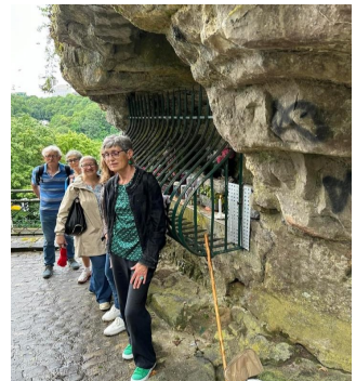
GuideForOneDay: Grott vum Péiter Onrou, Eecherbiërg, Stad Lëtzebuërg.

Par ailleurs, il a participé pour la cinquième fois au programme GuideForOneDay organisé par le ministère de l'Economie en ayant proposé trois sorties, les 26, 27 et 28 juillet, sous le thème: « Luxembourg Ville inconnue et préhistorique », afin de sensibiliser le public à la préhistoire.