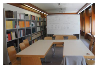
Le nouvel espace de la S.P.L. accueillant la bibliothèque dans une grande salle du rez-de-chaussée de l'ancien Hôtel des Cascades du Mullerthal.